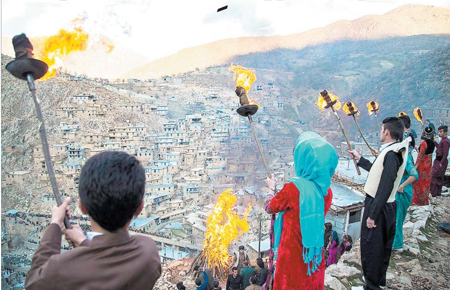
جشن نوروز در روستای پالنگان کردستان