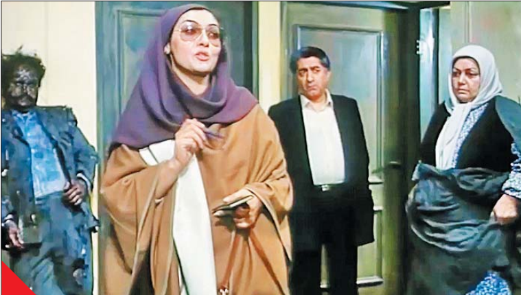
محتضای از «حاجر مژدین‌ها»

فرهاد توحیدی، فیلم‌نامه‌نویس صاحب‌نام سینما، دراین‌باره به «شرق» می‌گوید: «دوستانی که از برخی الفاظ برای تعریف سینمای کمدی استفاده می‌کنند، فارغ از اینکه درباره کدام فیلم صحبت می‌کنند، به نظرم قدر و قیمت کمدی را نمی‌شناسند. سخت‌بودن ساخت فیلم کمدی برای بسیاری مشخص نیست و معمولاً بسببی تمایل دارند از یک واژه فاخر برای تعریف از فیلم استفاده کنند و فکر می‌کنند اگر اکثر فیلم‌ها فاخر باشد، نه سخیف‌اند و نه پیش‌یافتاده!» او ادامه می‌دهد: «طبعاً فیلم‌های فاخر هم معنی مشخصی دارند و به