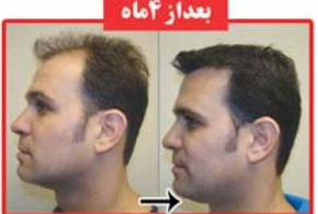
بعد از ۴ ماه