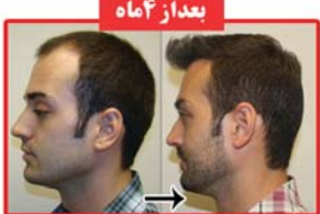
بعد از ۴ ماه