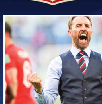
موزمداران انگلیسی به دنبال جلیقه ساوت‌کیت