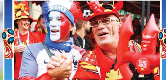
هواداران بلژیک و فرانسه