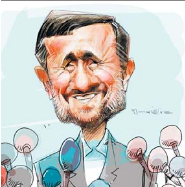
روایت امیری فر از جمله منسوب به احمدی نژاد