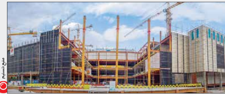
رئیس سازمان نظام مهندسی استان تهران

■ اساساً وقتی درصد بسیار زیادی از بودجه در همه شهرداری‌ها از طریق تخلفات ساختمانی و فروش تراکم تأمین می‌شود شما توقع دارید مهندسان چکار کنند؟ مهندسان تنها وظیفه‌ای که دارند و در قوانین ذکر شده این است که به مرجع صدور پروانه گزارش دهند