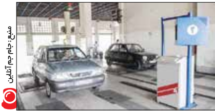
معم، دکنر، سلام