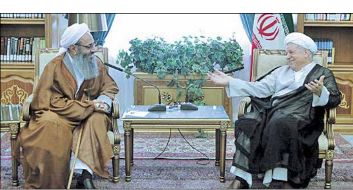
روابط عمومی مجمع تشخیص مصلحت نظام