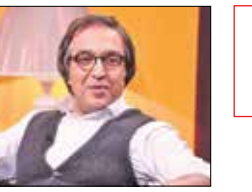
در گفت‌وگو با روزنامه زنده‌ایتینرتی «آهنگ»