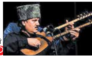
همزمان با برگزاری جشنواره موسیقی فیلم فجر