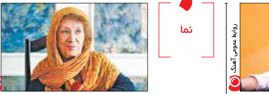
در نیمه اول سال ۹۷