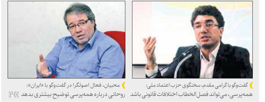
گفت‌وگو با گرامی مقدم، سخنگوی حزب اعتماد ملی؛ روحانی درباره همه‌پرسی توضیح بیشتری بدهد

تأثیر منفی گرد و غبار بر روح و روان دانش‌آموزان خوزستان نگاهی به کارنامه سیاسی حسن ارستجانی / وزیر برای اصلاحات ارضی