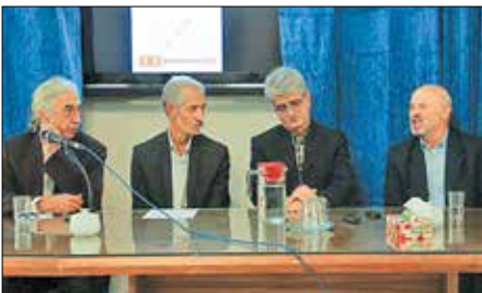
نشست خبری دومین نمایشگاه سازخانه موسیقی برگزار شد