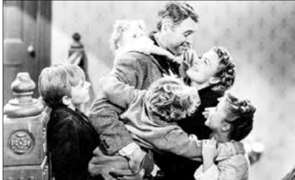
نمایی از فیلم «یک زندگی شگفت‌انگیز»

ایران؛ سال جدید میلادی تازه از راه رسیده است. فیلم‌های مربوط به کریسمس در ماه ژانویه طرفداران بسیاری دارد و بواسطه یک سنت جافتاده میلیون‌ها نفر در سرتاسر دنیا در ژانویه پای فیلم‌هایی می‌نشینند که مربوط به سال نو و کریسمس هستند. اگر چه فیلم‌های زیادی با این موضوع خاص وجود دارند که به کلاسیک‌های پر تکرار دوران تعطیلات سال نو تبدیل شده‌اند اما