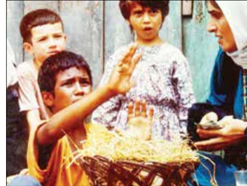
باشو غریبه کوچک