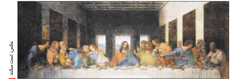
عکس است سگند

مهم نیست اهل هنر باشید یا نباشید؛ برخی آثار شاخص هنری هستند که با توجه به شهرت و معروفیت عامی که دارند و با توجه به تیراژ بالایی که در اشکال پوستر یا کپی در دسترس بوده‌اند، برای اکثر آدم‌ها در گوشه و کنار دنیا-و در کشور خودمان- بسیار آشنا باشند. آثاری که احیاناً پوسترشان را بر دیوار فلان قهوه‌خانه دورافتاده بین راهی یا بر دیوار یک بنگاه در یک شهرستان و یا به عنوان بافته‌ای در قاب یک تابلو فرش در خانه خویشاوندی آنها را دیده باشید. ممکن است تنها اسمی از این دست کارها شنیده باشید یا شاید حتی اسمش را هم ندانید و اصولاً خبر نداشته باشید که خالق این اثر کیست و چه زمانی آفریده شده است. «شام آخر» یکی از همین آثار است. یکی از شاهکارهای هنری «لئوناردو داوینچی» نقاش ایتالیایی قرن پانزدهم. جالب است بدانید که این نقاشی را نمی‌توانید در هیچ یک از موزه‌های جهان پیدا کنید و اگر بخواهید این اثر را ببینید باید سری به شهر