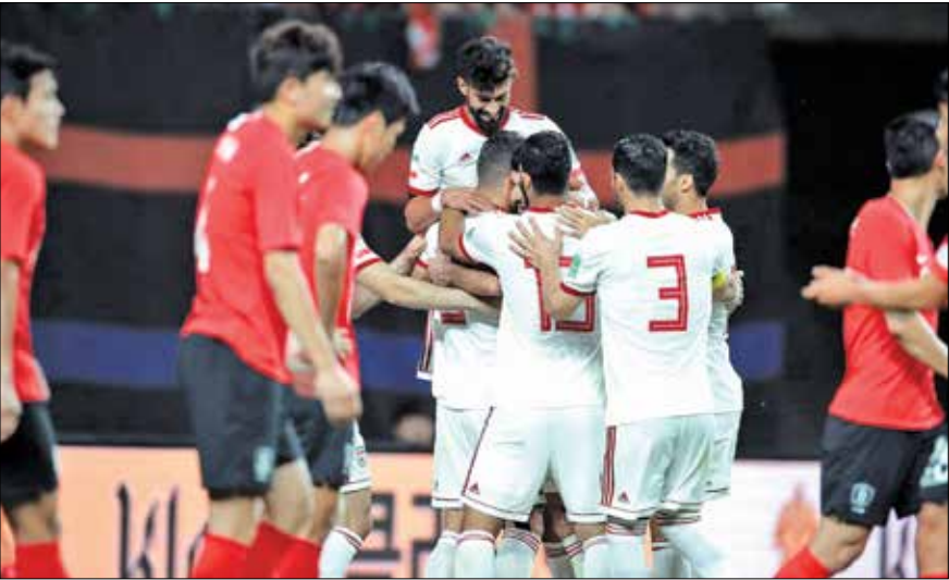
سایت خبر اسپورت فوتبال

مصاحبه‌ای مفصل با ماتویدی، هافبک سیاهپوست و خلاق تیم ملی فوتبال فرانسه و عکس بزرگی از چهره وی، صفحه اول این هفته‌نامه پراعتبار را تسخیر کرده است. «فرانس فوتبال» به سرنوشت تیره لئوناردوی برزیلی پس از بازگشتش به میلان و اهداف آندره ویاس بواش، سرمربی پرتغالی و جدید باشگاه مارسی فرانسه هم اشاراتی دارد.