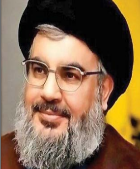
سید حسن نصرالله

امام خمینی(ره) معتدل و میانه‌رو بودند و فهم و درک ایشان از مبانی اسلامی مبتنی بر اعتدال بود و اعتدال همواره در فتاوا و مواضع ایشان دیده