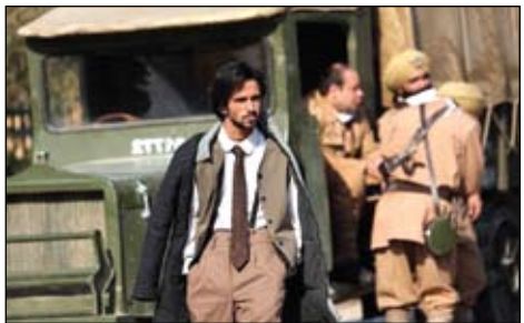
به بهانه اکران فیلم بیتیم‌خانه ایران