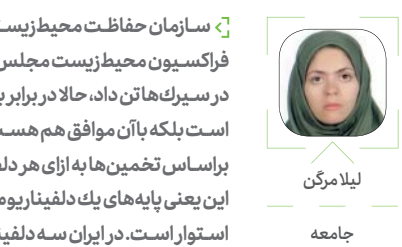
لیلا مرگن جامعه

دلفین ها پستانداران باهوش و جذاب آب های سراسر جهان هستند که به دلیل جذابیت های ظاهری و توانایی در ارائه نمایش، قربانی تجارت دلفیناریوم داران می شوند. دلفین هایی که به دلفیناریوم های دنیا اعزام می شوند، جذاب ترین افراد يك جمعیت هستند که سایر اعضای خانواده شان برای عرضه گوشت به بازار مصرف، سلاخی شده و این اعضای کوچک هم وارد تجارت نمایش حیوانات می شوند تا بقیه عمر خود را در اسارت بگذرانند. شاید تکان دهنده ترین مستندی که درباره نحوه تامین دلفین های نمایشی ساخته شده، مستند The Cove است. براساس اطلاعات این مستند، ماه سپتامبر هر سال فصل خونینی برای دلفین های خلیج تایچی ژاپن است، زیرا ماهیگیران ژاپنی از اوایل سپتامبر تا پایان فوریه و به مدت شش ماه حدود ۲۰۰۰ دلفین را می کشند. قبل از ساخت این مستند به دلیل وجود تقاضا برای گوشت دلفین، تعداد جوازهای صادر شده برای صید این پستاندار دریایی کمی بیشتر بود اما با افزایش سقف آگاهی مردم، حالا تعداد مجوزهای صادره از سوی دولت ژاپن کاهش یافته است. براساس آنچه در این مستند به نمایش درآمده، دلفین هایی که ناگزیرند تمام عمر خود را در اسارت بگذرانند، عمدتاً از صید گله های دلفین در خلیج تایچی تامین می شوند و بدون شك پایه گذاران دلفیناریوم ها در تداوم این تجارت خونبار سهیم هستند.