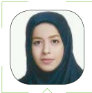
غسل خوبان طهرانی