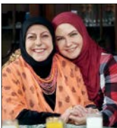
مراسم عروسی در تهران، ۲۱ خرداد ۱۳۹۸