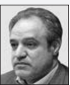
محمد محمودی شاه‌نشین

در کنار آن موضوع تناسب هم مطرح می‌شود؛ به این معنا که همه‌اقترا هستند بتوانند نماینده‌ای در مجلس داشته باشند. حرف این است که در شرایط فعلی و قانون انتخاباتی که در حال حاضر آن را اجرامی کنیم باعث شده است بخش زیادی از مردم در مجلس نماینده نداشته باشند. نمونه عینی این موضوع را اینکه استانی شدن شرح کرد که نمایندگان می‌توانند نماینده‌ای مجلس می‌شوند با انتخاب نزدیک به ۴۰ درصد از مردم صاحب کرسی شده‌اند. حال سوال اینجاست که سهم آثانی که پای صندوق نرفته‌اند چه می‌شود؟! اینجنا پاسخ این است که ما باید ساز و کاری ایجاد کنیم پیروزی مشخص باشد. در حالی که نمایندگان به صورت فردی وارد انتخابات می‌شوند بر نامه‌ای راهم به صورت تناسبی شدن انتخابات است. در حال حاضر از افغانستان و عراق که در همسایگی ما قرار دارد تا آلمان و کشورهای توسعه یافته این شیوه انتخابات را اجرا می‌کنند. این همان شیوه‌ای است که اجازه می‌دهد همه اقشار جامعه سهمی در مجلس داشته باشند و حتی افرادی